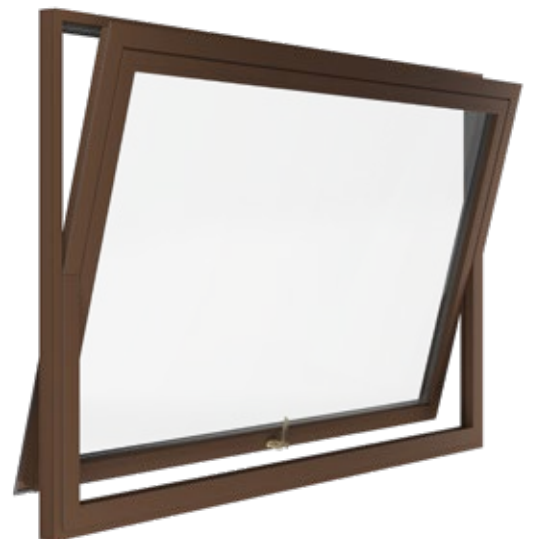
Bilico aperto vista laterale